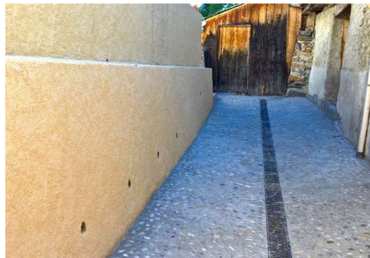
La ruelle derrière le musée est terminée