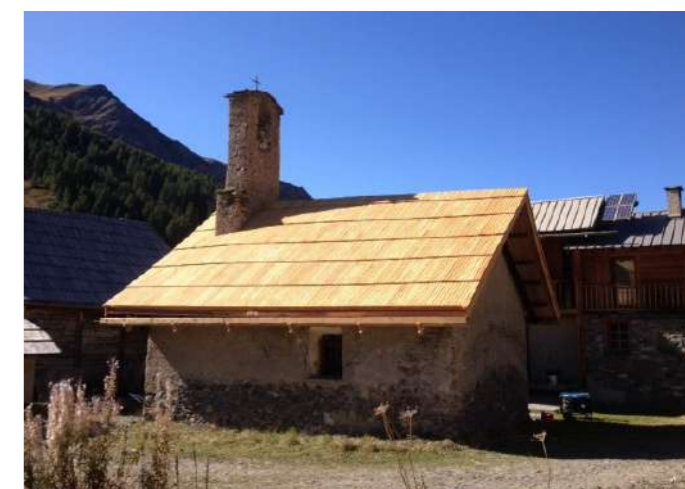
Réfection des toitures des chapelles des Chalps et des Fonts