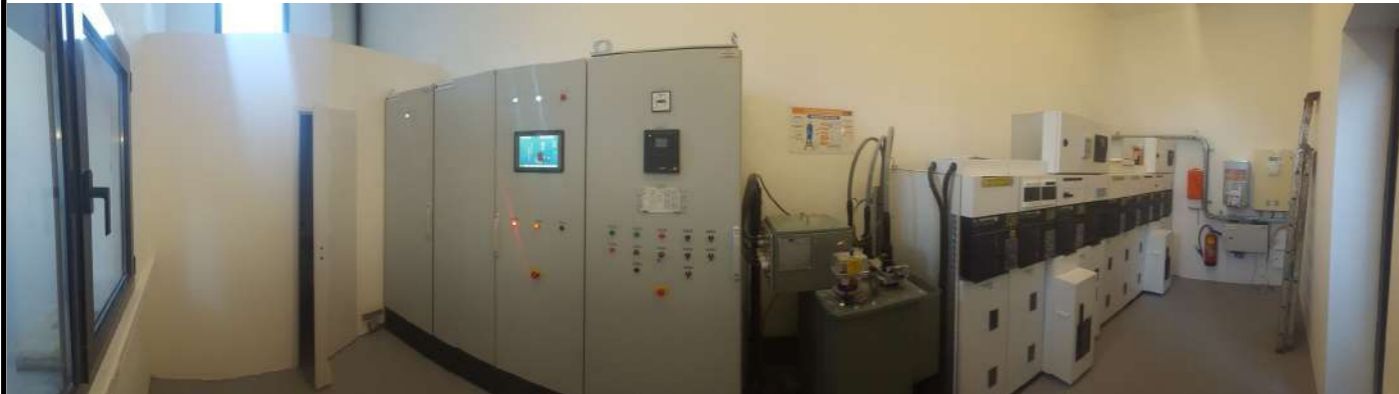
Vue panoramique de la salle de commandes

Un grand merci à vous tous pour avoir contribué à la bonne réalisation de ce projet et à votre patience lors de la phase de construction (poussière, bruit, circulation d'engins, etc.).