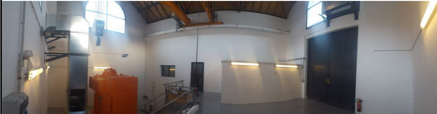
Vue panoramique de la salle des machines