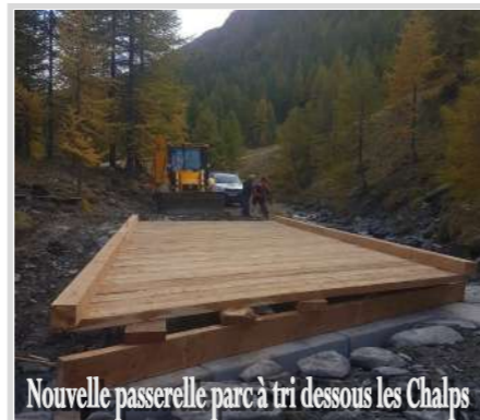
Nouvelle passerelle parc à tri dessous les Chalps