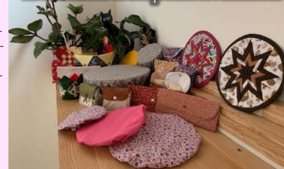
Un échantillon de nos premières réalisations

À l'étude : un atelier créatif à destination des enfants de Cervières accompagnés d'un adulte.