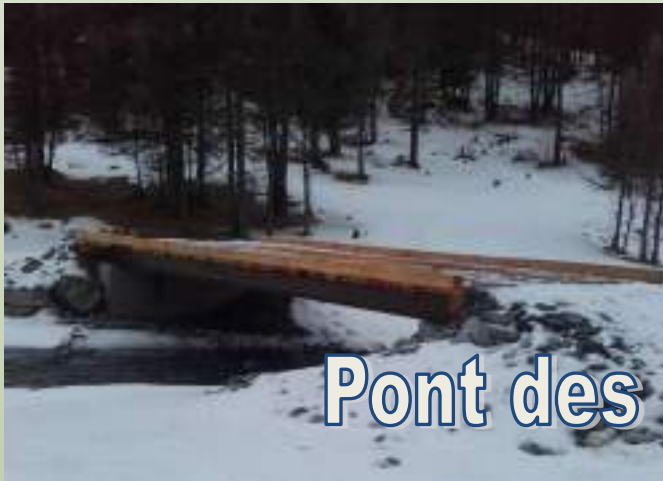
Pont des Preynard