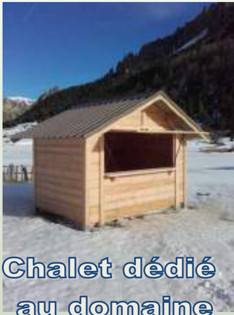
Chalet dédié au domaine nordique