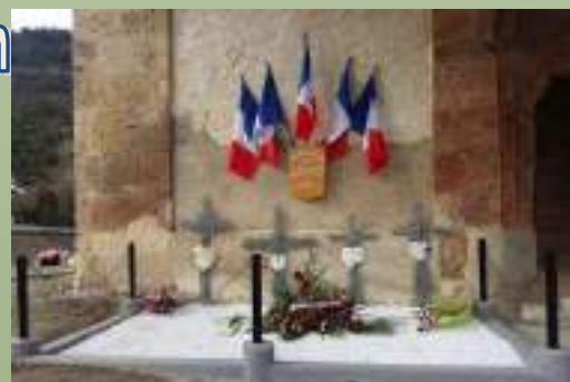
Création d'un carré militaire