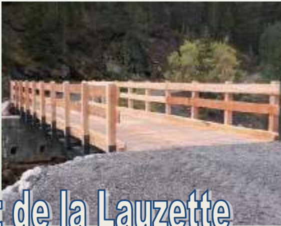
Pont de la Lauzette