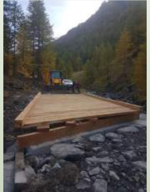
Passerelle parc a tri