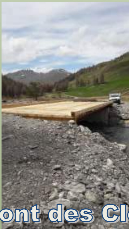
Pont des Clots