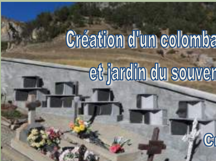
Création d'un colombarium et jardin du souvenir