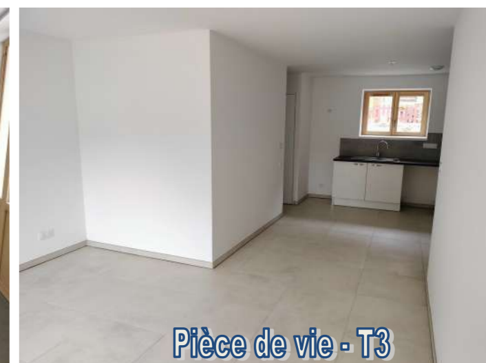
Pièce de vie - T3