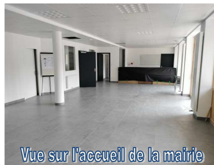
Vue sur l'accueil de la mairie