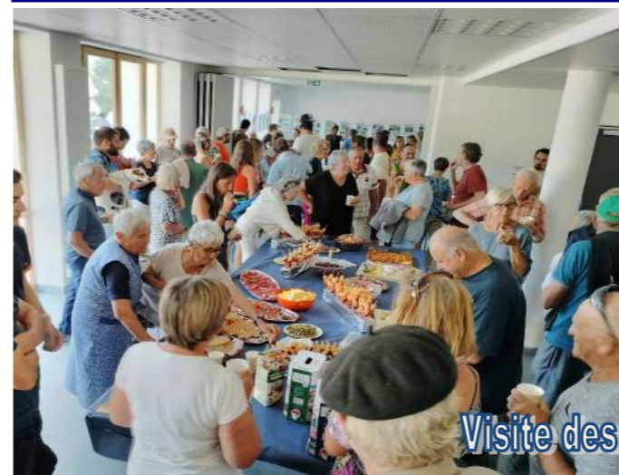
Visite des locaux 25 août

A ce jour, il n'y a aucun projet concernant les locaux de « l'ancienne mairie ». La vétusté des lieux, nécessitera de toute façon une réhabilitation en cas de nouveau projet.